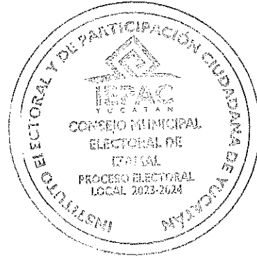
C. RICARDO SANTIAGO ESPADAS CHALE CONSEJERO ELECTORAL