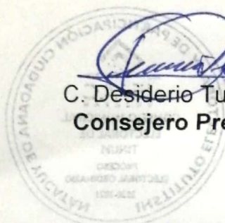
[Signature] C. Desiderio Tun Herrera Consejero Presidente

Por último y con fundamento en el artículo 184 de la Ley de Instituciones y Procedimientos Electorales del Estado de Yucatán y el artículo 23 numeral 4 del Reglamento de Sesiones de los Consejos del Instituto Electoral y Participación Ciudadana de Yucatán, remítase copia del acta de la presente Sesión de Instalación a la Consejera Presidente del Consejo General del Instituto Electoral y de Participación Ciudadana de Yucatán. -----