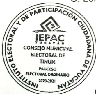
[Signature] C. Lorena de Jesús Nahuat Martín Secretario Ejecutivo