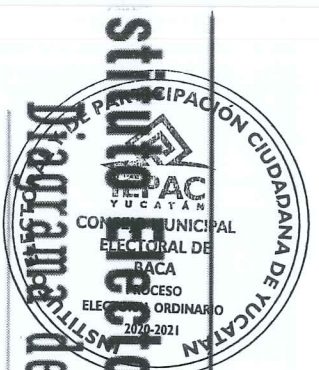
Diagrama de Flujo de la Recepción de Paquetes Electorales